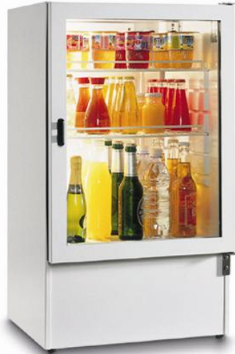
LT 75 PV

Réfrigérateur de 75 litres Mini réfrigérateur à compression en 220V DEGIVRAGE MANUEL